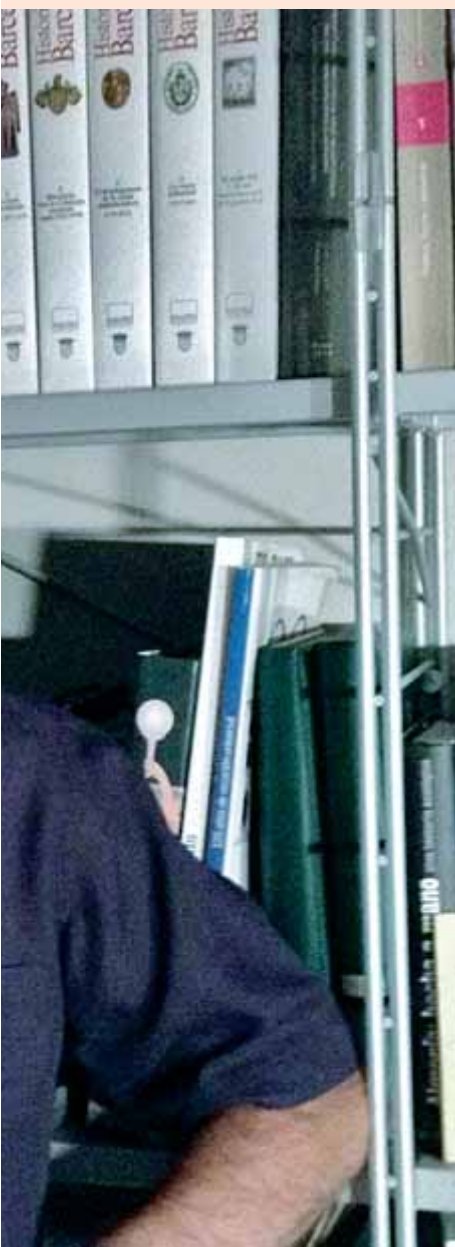
a forçar l'ajust a les autonomies.